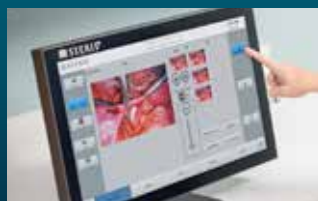
Desde los sistemas de integración Harmony iQ™