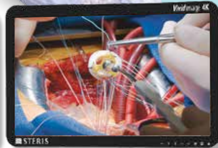
4 000 K Ra=95 / R9=97