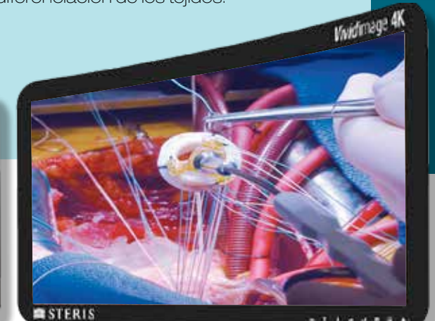
5 000 K Ra=95 / R9=97

Calidad de luz constante y homogénea en el tiempo y para cada temperatura de color seleccionada.