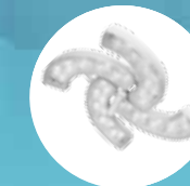
4 focos o spot

De 1 a 4 focos o spots y hasta 3 cúpulas en un anclaje Diámetro del punto luminoso fijo o ajustable