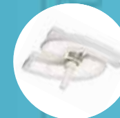
2 focos o spot