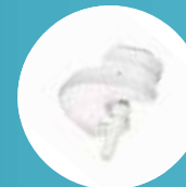
1 foco o spot