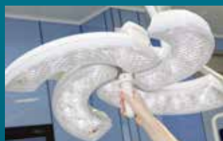
Control del diámetro del punto luminoso desde el mango esterilizable