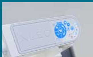
Desde el panel de control