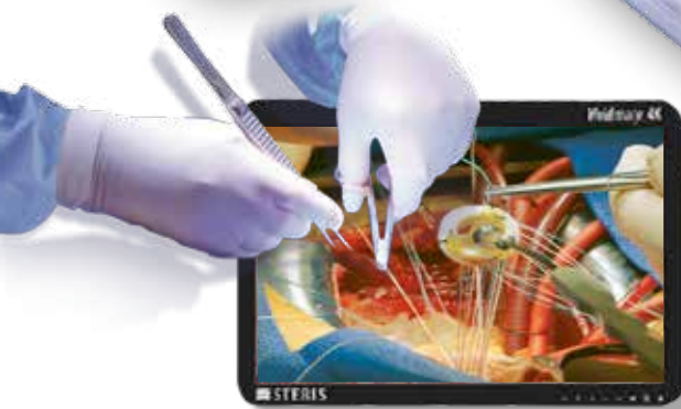
3 500 K Ra=95 / R9=91